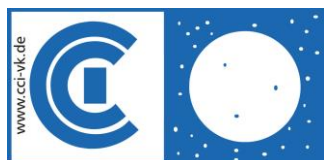
CCI – von Kahlden GmbH